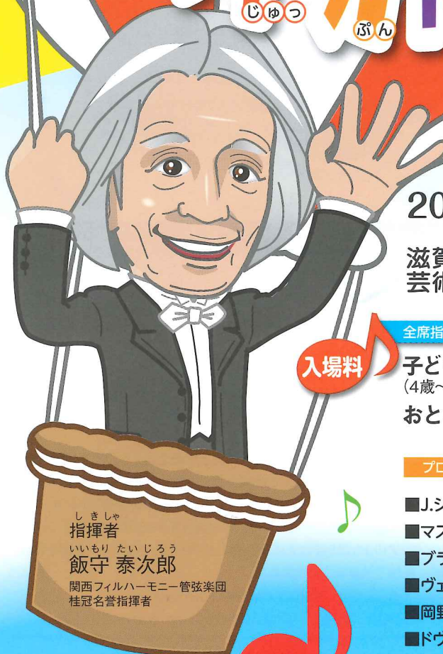
しきしゃ 指揮者 いもり たいじろう 飯守 泰次郎 関西フィルハーモニー管弦楽団 桂冠名誉指揮者

2016年 3月19日(土) 14:00開演 (13:15開場) ※公演時間は休憩を含み約100分を予定しています。