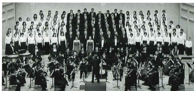
2018年 第41回演奏会:日本センチュリー交響楽団との共演

1973年、浜松市の市民合唱団として初めてベートーヴェンの「第九」を歌い、1981年からは39年間連続でプロのオーケストラと歌い続けている。