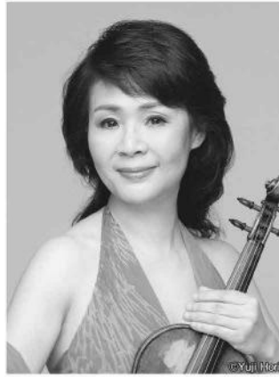
渡辺 玲子◎ヴァイオリン WATANABE Reiko, Violin

超絶的なテクニック、玲瓏で知的な音楽性、切れ味鋭い官能性と幅広いレパートリーで、世界のヴァイオリン界をリードする逸材。1984年ヴィオッティ、86年パガニーニ両国際コンクールで最高位を受賞。これまでにワシントン・ナショナル響、ロサンゼルス・フィル、フィルハーモニア管、BBC響、ウィーン・トーン・キュンストラ管、ロシア・ナショナル管などと共演。とりわけシノーボリ指揮ドresden・シュターツカペレ、サンクトペテルブルク響との共演はCDもリリースされ、大好評を博した。またリンカーン・センターにおいてニューヨーク・デビューを果たし、その後もラヴィニア音楽祭、イタリアのストレーサ音楽祭等に出演。近年は、バレエとのコラボレーションや現代作品の初演などの演奏活動のみならず、国際教養大学特任教授として英語による集中講義を行うほか、「子どもたちのためのレクチャー・コンサート」、ラジオ番組「渡辺玲子の弓語り」のパーソナリティーを務めるなど、教育活動や音楽の魅力を広く伝える活動にも取り組んでいる。CDも数多くリリース、最新盤は“poetry”。05年エクソン・モービル音楽賞奨励賞、18年には世界で活躍する女性に与えられる「リコグニション・アワード2018」を受賞。使用楽器は、日本音楽財団より貸与されたストラディヴァリウス1735年製「サマズィユ」。