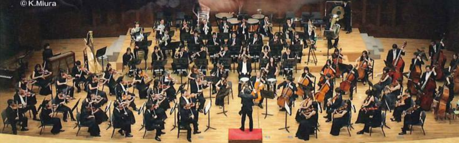
【管弦楽】関西フィルハーモニー管弦楽団