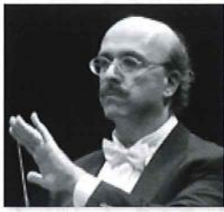
[指揮] ガイド・マリア・ガイダ