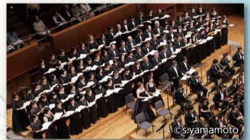
合唱: 関西フィルハーモニー合唱団 Kansai Philharmonic Choir

2019 7.12 金 19:00開演 (18:00開場) 18:40~ 指揮: 飯守 泰次郎によるプレトーク開催! ザ・シンフォニーホール