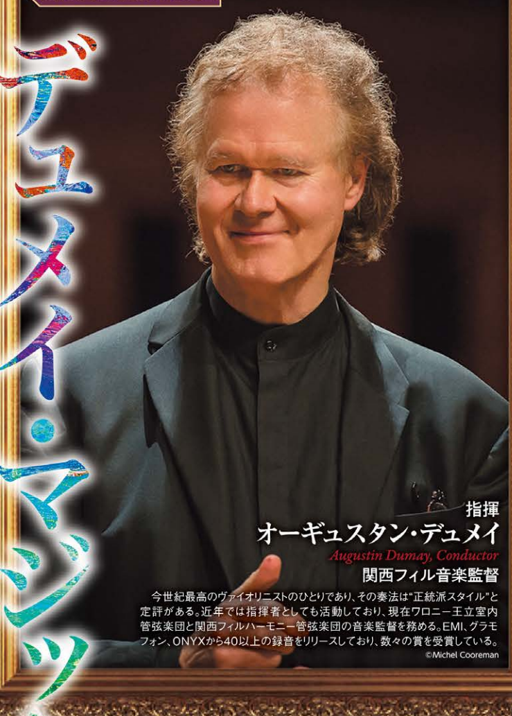
指揮 オーギュスタン・デュメイ Augustin Dumay, Conductor 関西フィル音楽監督

今世紀最高のヴァイオリニストのひとりであり、その奏法は“正統派スタイル”と定評がある。近年では指揮者としても活動しており、現在ワロニー王立室内管弦楽団と関西フィルハーモニー管弦楽団の音楽監督を務める。EMI、グラモフォン、ONYXから40以上の録音をリリースしており、数々の賞を受賞している。