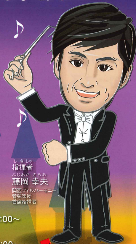
指揮者 ふじおか さちお 藤岡 幸夫 関西フィルハーモニー 管弦楽団 首席指揮者