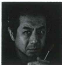
指揮 キンボー・イシイ

最近不調続きの青年マックス クーノの娘、アガーテとの結婚を実現させるためには どうしても明日の射撃試験を成功させなければならない …遂に彼は、悪魔の弾丸を手に入れた!