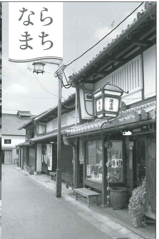
近鉄奈良駅下車徒歩約15分