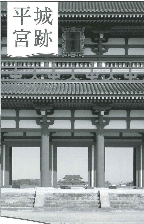
大和西大寺駅下車徒歩約15分