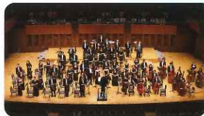
【演奏】 関西フィルハーモニー管弦楽団