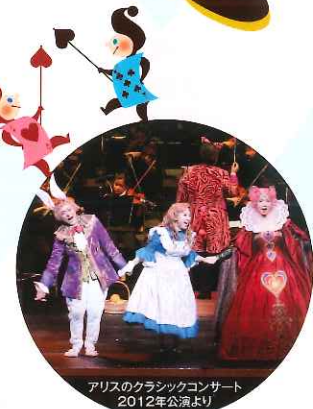
アリスのクラシックコンサート 2012年公演より