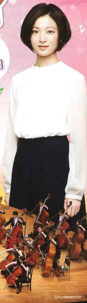
〈ナビゲート〉 野々すみ花 〈元宝塚歌劇団 宙組トップ娘役〉