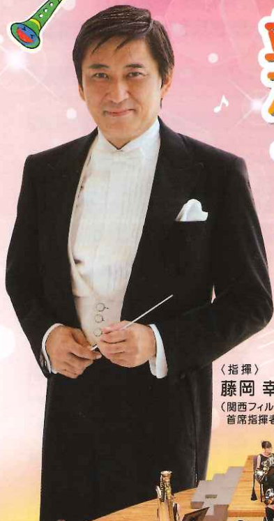
〈指揮〉 藤岡 幸夫 〈関西フィル 首席指揮者〉