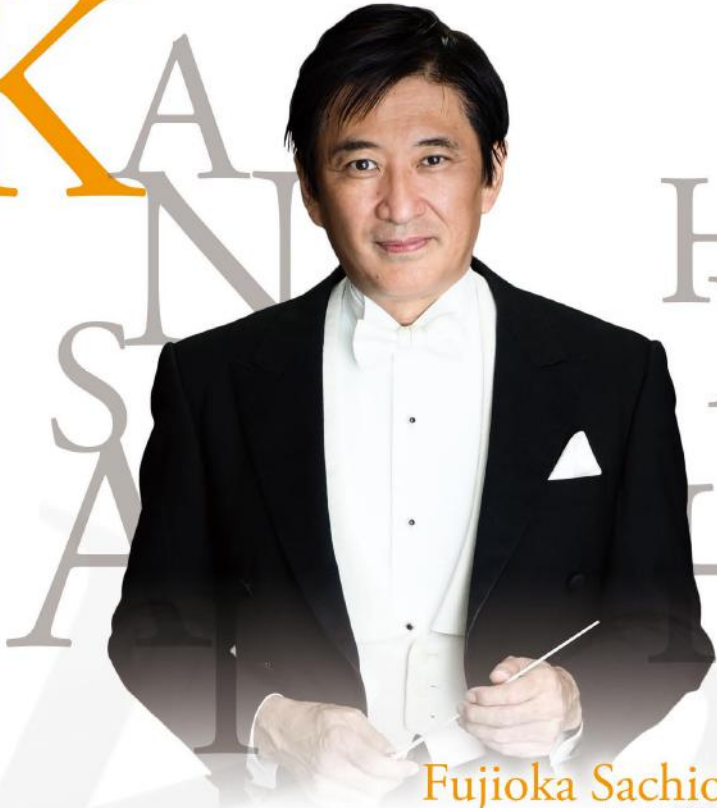
Fujioka Sachio ©SHIN YAMAGISHI